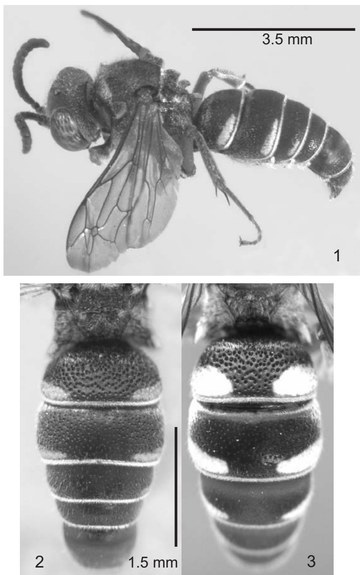
Figs. 1-3. Especies de Zanysson . 1. Vista lateral del macho holótipo de Z. caonao sp. nov. (FSCA). Vista dorsal del metasoma del macho mostrando el patrón de manchas: 2. Z. caonao sp. nov. 3. Z. armatus .