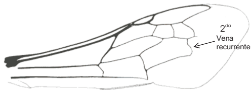
Fig. 4. Ala superior de un miembro del género Colletes , mostrando las venas y celdillas. Tomado de Michener et al. (1994).

Los machos de las especies cubanas presentan gran diferenciación en la forma del esterno VII, por lo que esta estructura alcanza un gran valor taxonómico para separarlas.